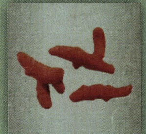
हरिद्रा (Curcuma longa)