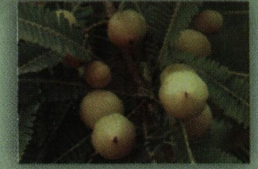
अमलकी (Emblca officinalis)

गिलोय, आँवला, अश्वगंधा, गाय का दूध, तक्र (छाछ)