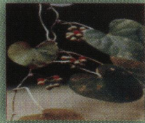
गुडूची (Tinospora cordifolia)

आयुर्वेद की मुख्य चिकित्सा पद्धतियों में शरीर संशोधन हेतु "पंचकर्म" अर्श एवं भगन्दर की चिकित्सा के लिए "क्षारसूत्र" तथा स्वास्थ्य संवर्धन व वृद्धावस्था स्वास्थ्य रक्षा हेतु "रसायन चिकित्सा" प्रचलित है। ये विधियाँ जीर्ण एवं कृच्छ्रसाध्य रोगों के उपचार के अधिक प्रभावकारी सिद्ध होती हैं।