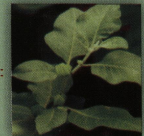
अश्वगंधा (Withania somnifera)